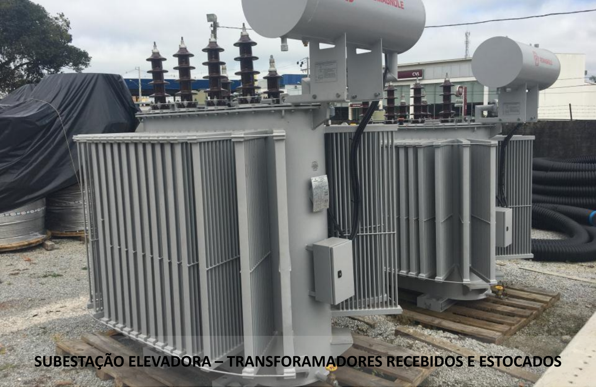
SUBESTAÇÃO ELEVADORA – TRANSFORMADORES RECEBIDOS E ESTOCADOS