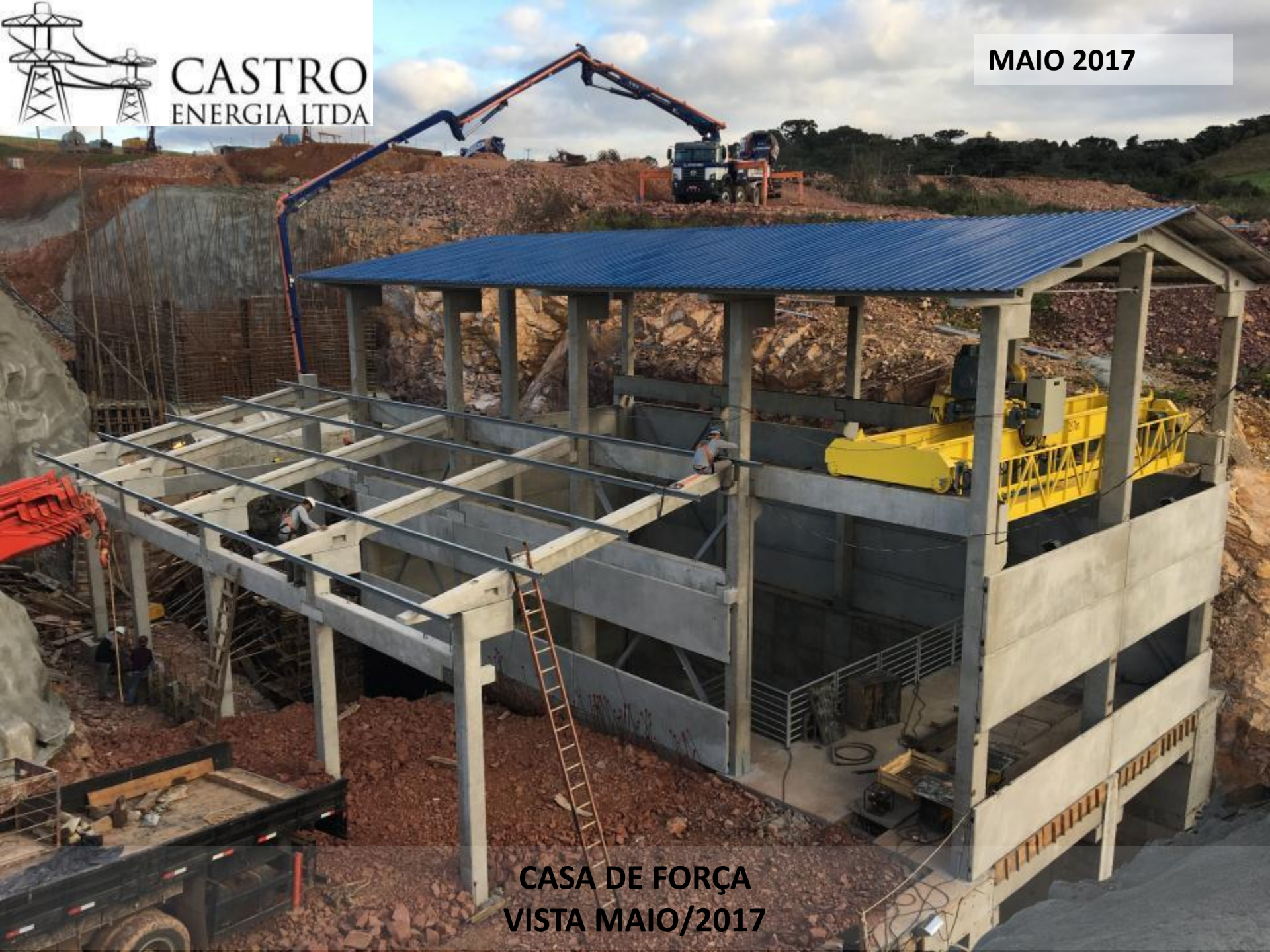
CASA DE FORÇA VISTA MAIO/2017