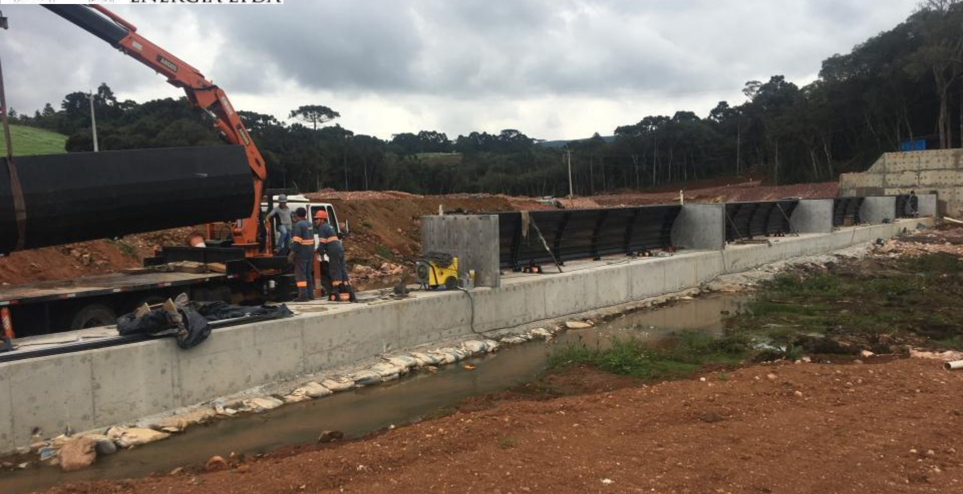
BARRAGEM VERTEDOURO MONTAGEM DAS COMPORTAS BASCULANTES VISTA DE JUSANTE