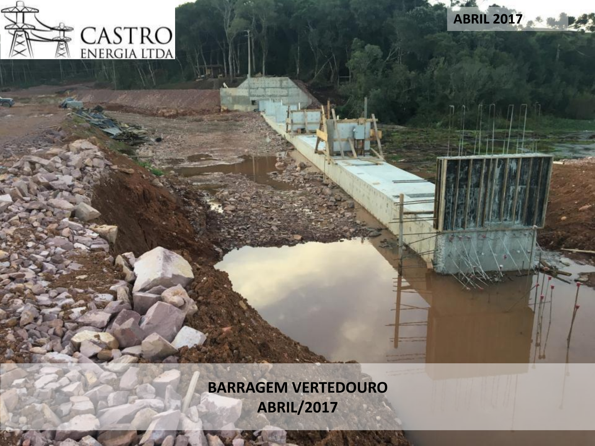
BARRAGEM VERTEDOIRO ABRIL/2017