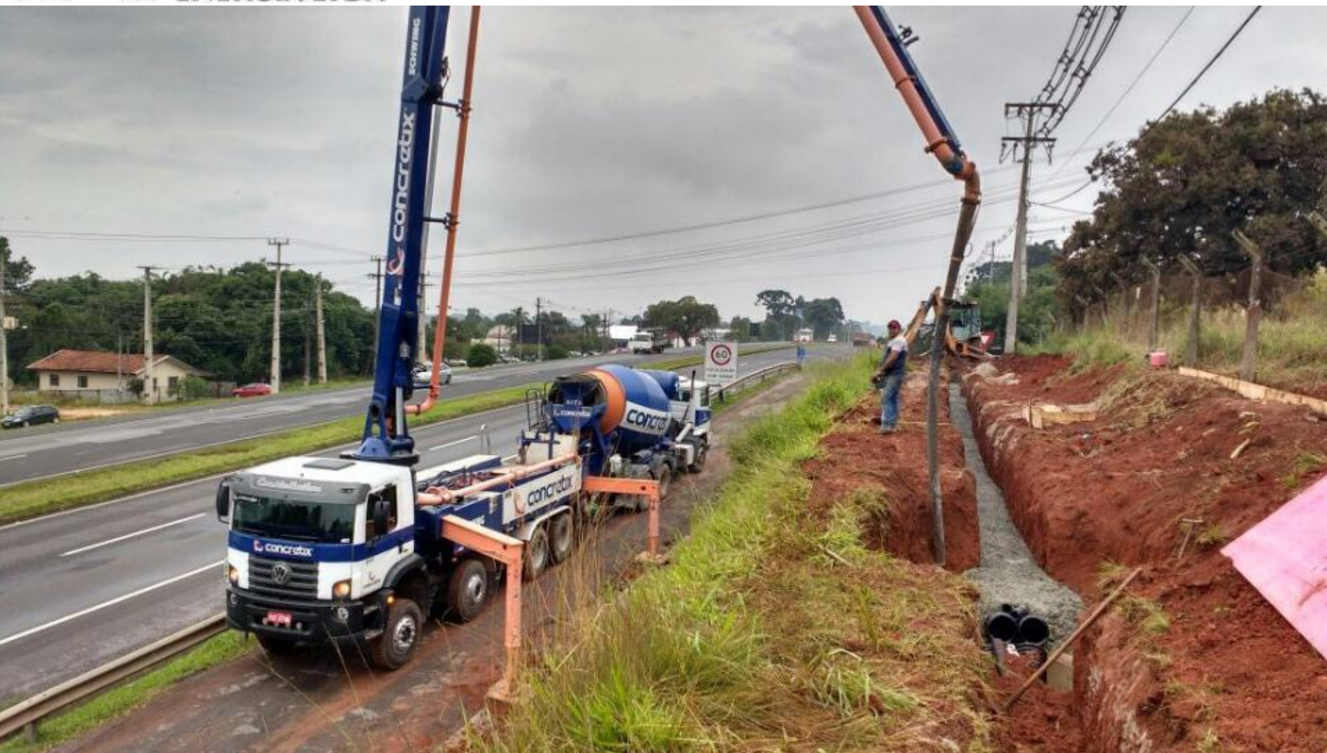
EXECUÇÃO DA REDE SUBTERRÂNEA NA CHEGADA DA SUBESTAÇÃO CASTRO – ENVELOPAMENTO DA TUBULAÇÃO