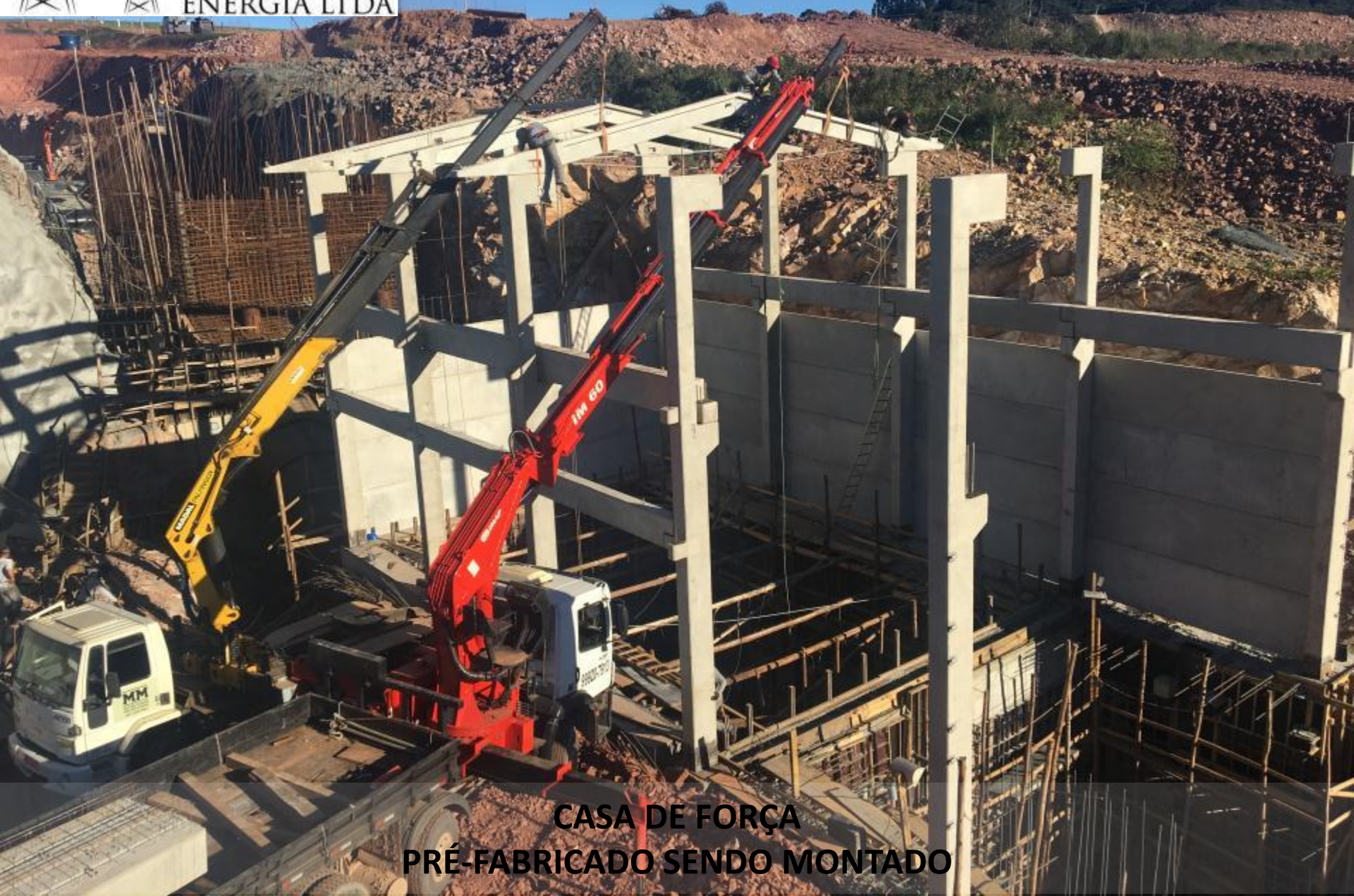
CASA DE FORÇA PRÉ-FABRICADO SENDO MONTADO