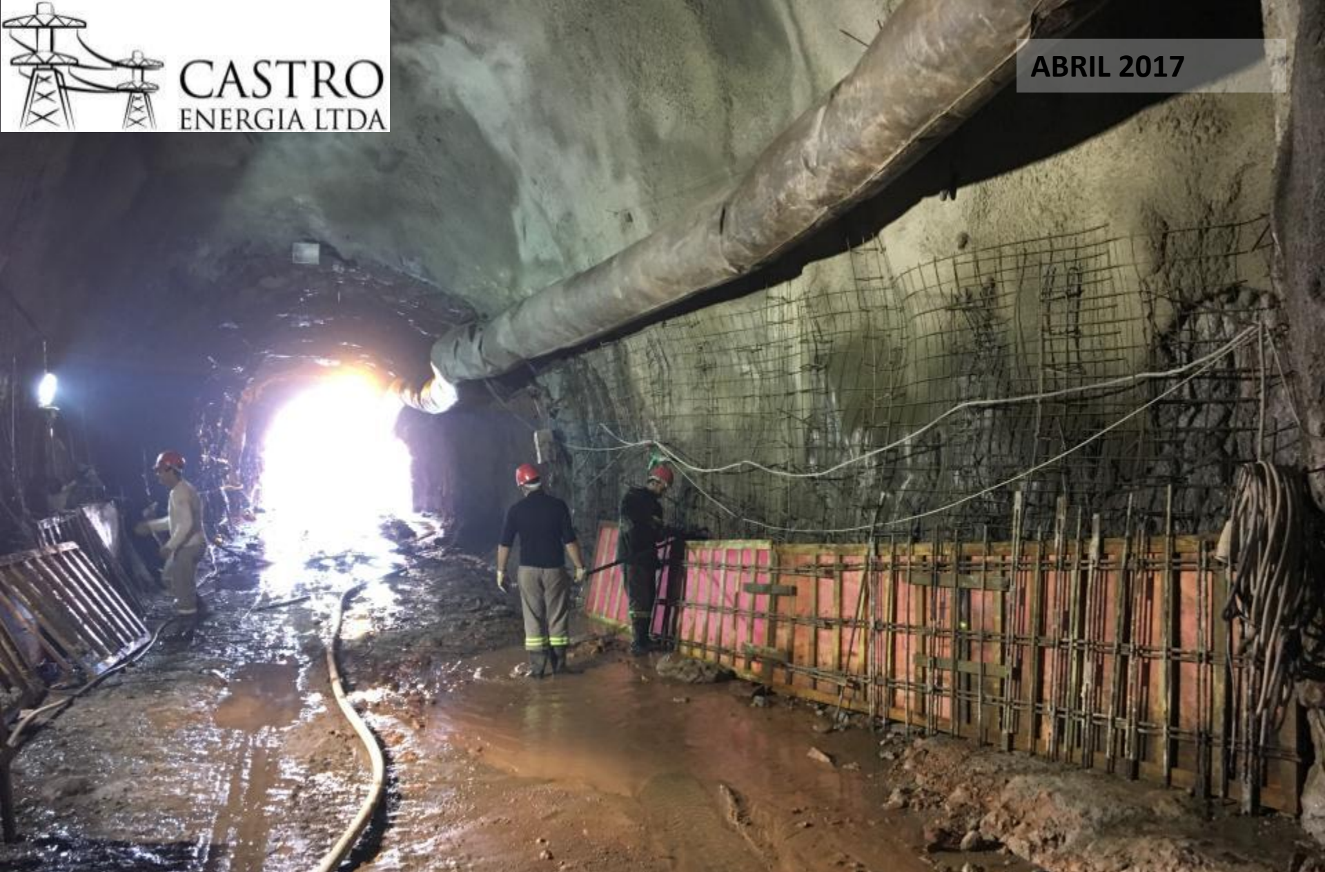
TÚNEL ADUTOR - JUSANTE EXECUÇÃO DE TRATAMENTOS ABRIL TRECHO 1