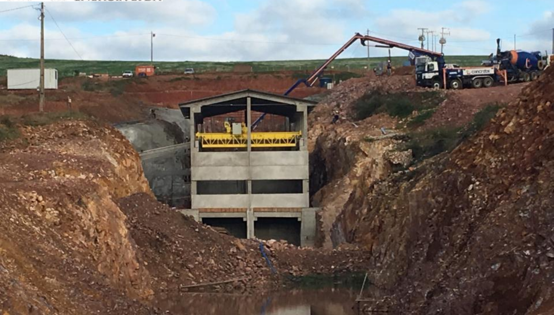
CASA DE FORÇA VISTA DE JUSANTE