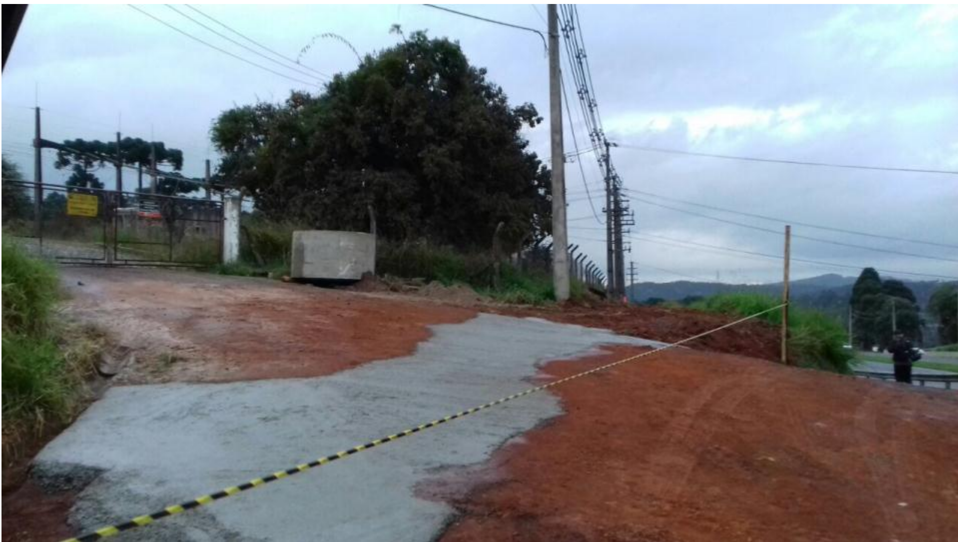
EXECUÇÃO DA REDE SUBTERRÂNEA NA CHEGADA DA SUBESTAÇÃO CASTRO - CONCLUÍDA