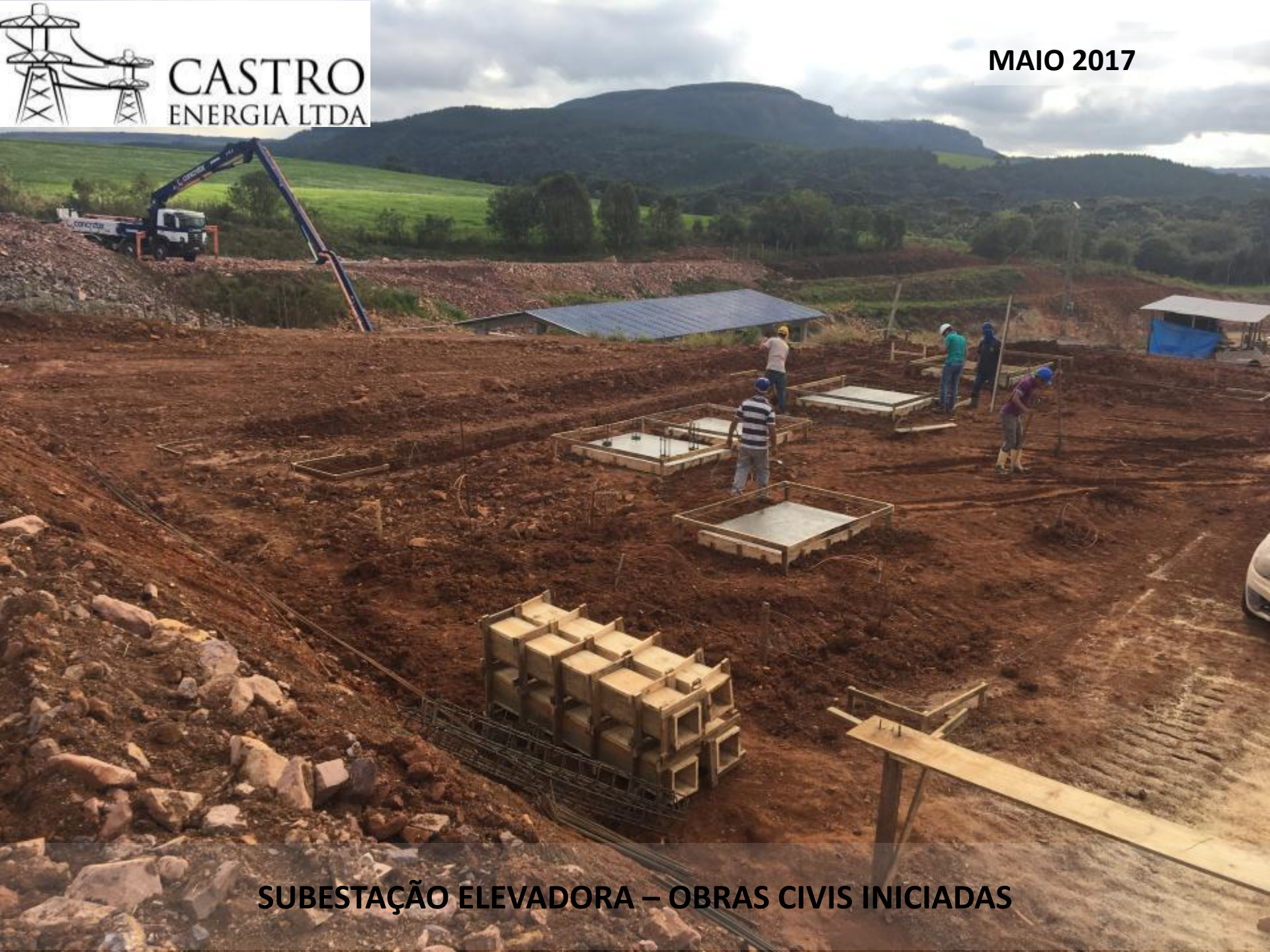
SUBESTAÇÃO ELEVADORA – OBRAS CIVIS INICIADAS