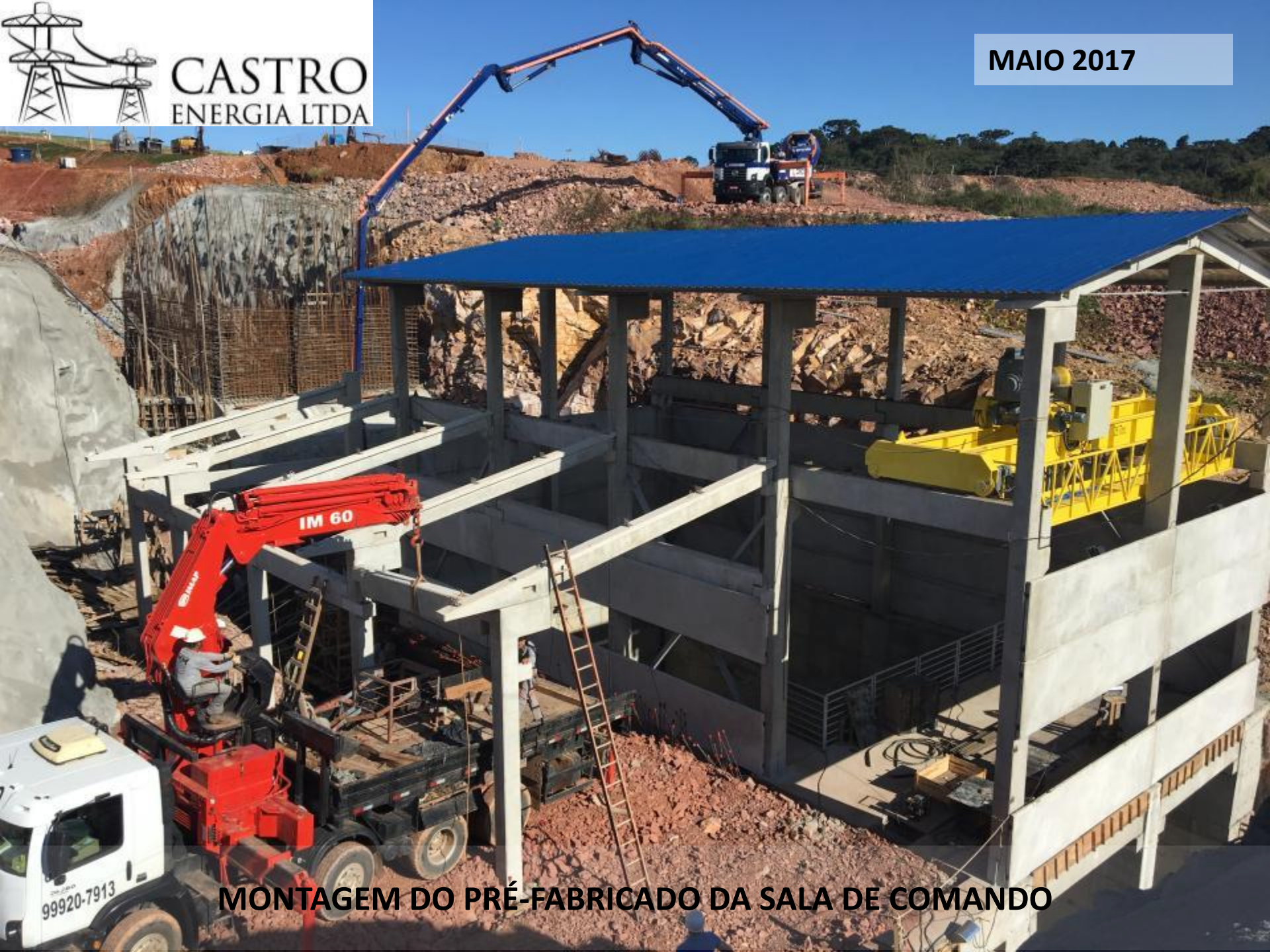
MONTAGEM DO PRÉ-FABRICADO DA SALA DE COMANDO