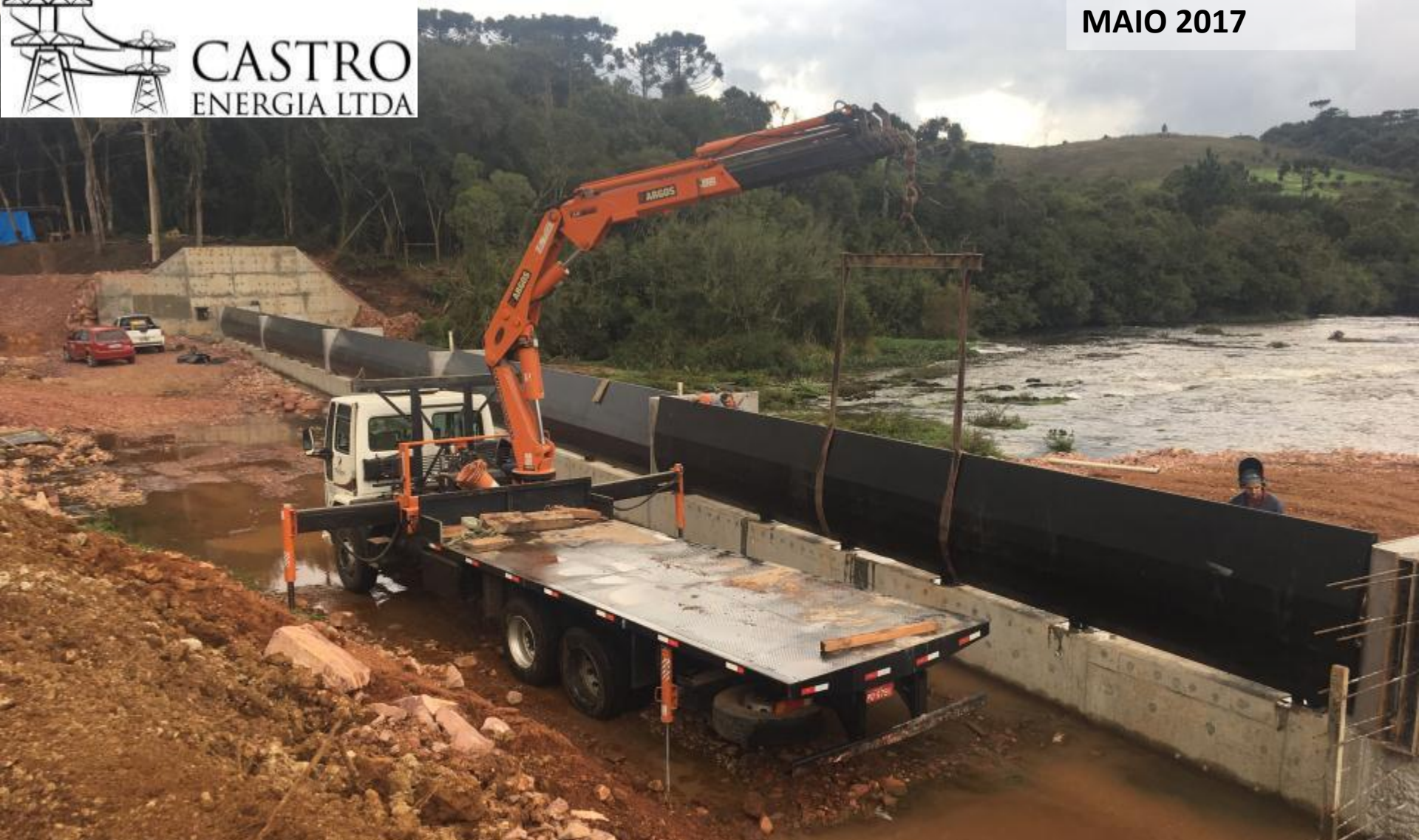
BARRAGEM VERTEDOIRO MONTAGEM DAS COMPORTAS BASCULANTES