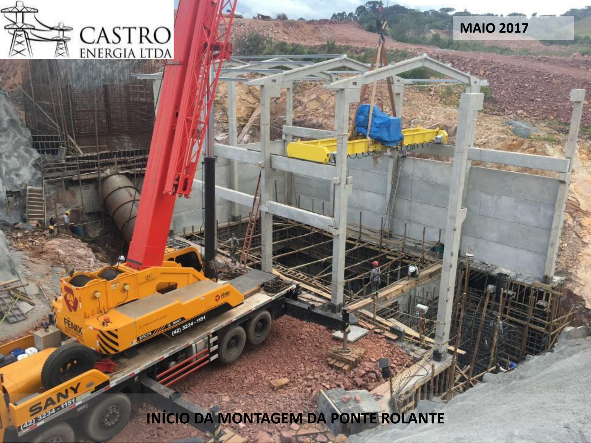
INÍCIO DA MONTAGEM DA PONTE ROLANTE