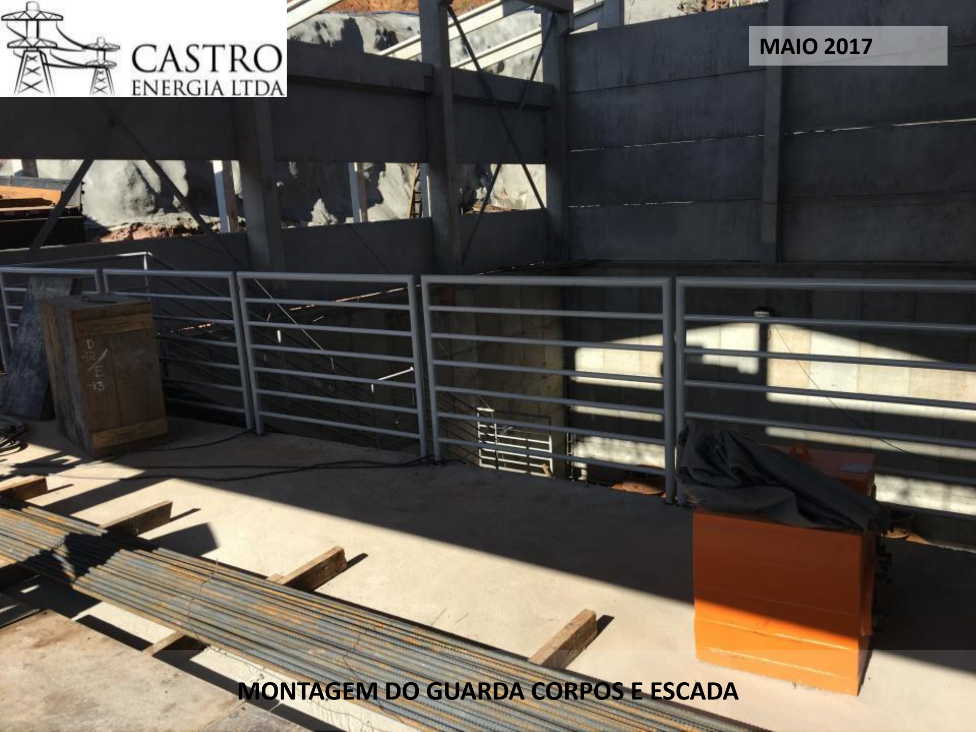
MONTAGEM DO GUARDA CORPOS E ESCADA