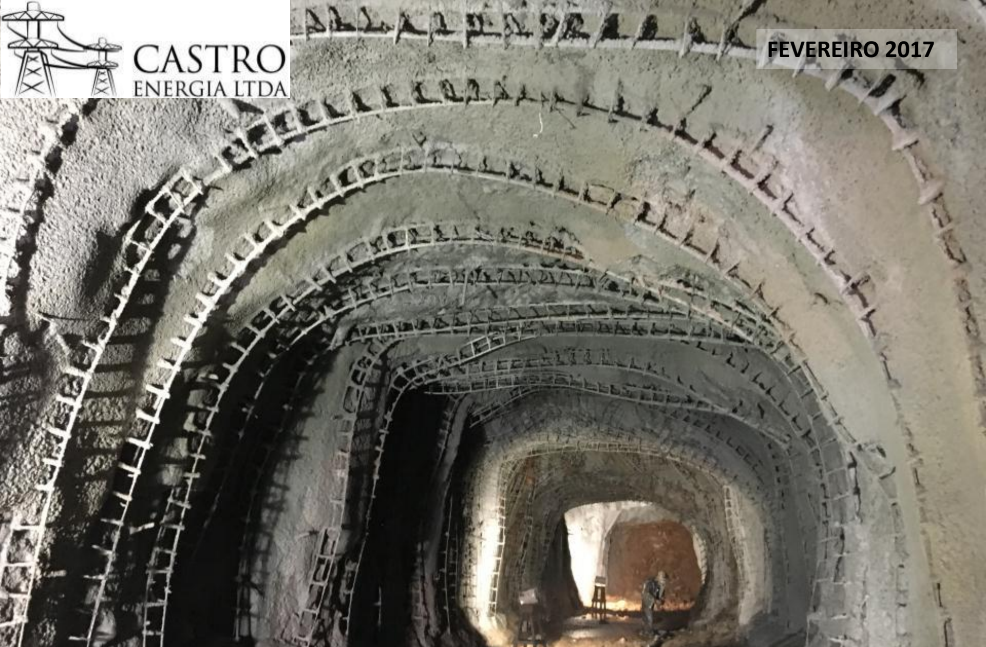
TÚNEL ADUTOR - JUSANTE ASPECTO DO TRATAMENTO COM ARMADURAS E CONCRETO PROJETADO EM FEVEREIRO/17