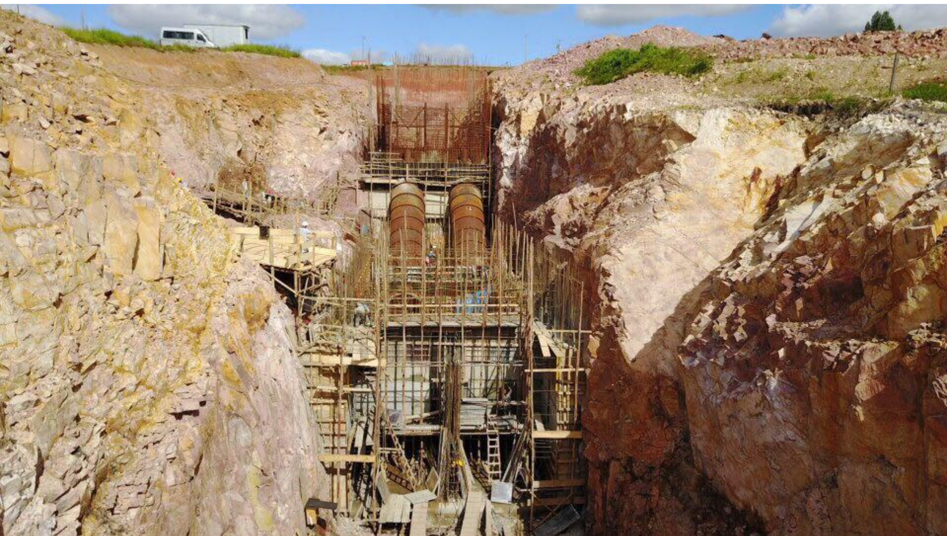
VISTA GERAL DO SETOR DE JUSANTE TOMADA D'ÁGUA – CONDUTO E CASA DE FORÇA