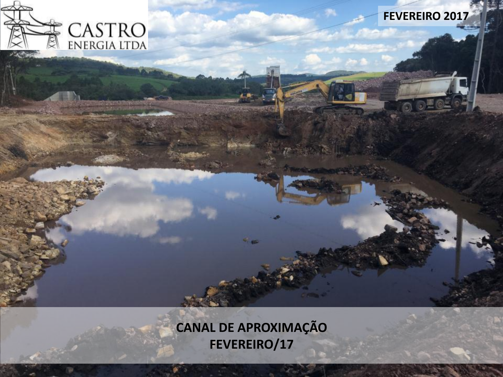
CANAL DE APROXIMAÇÃO FEVEREIRO/17