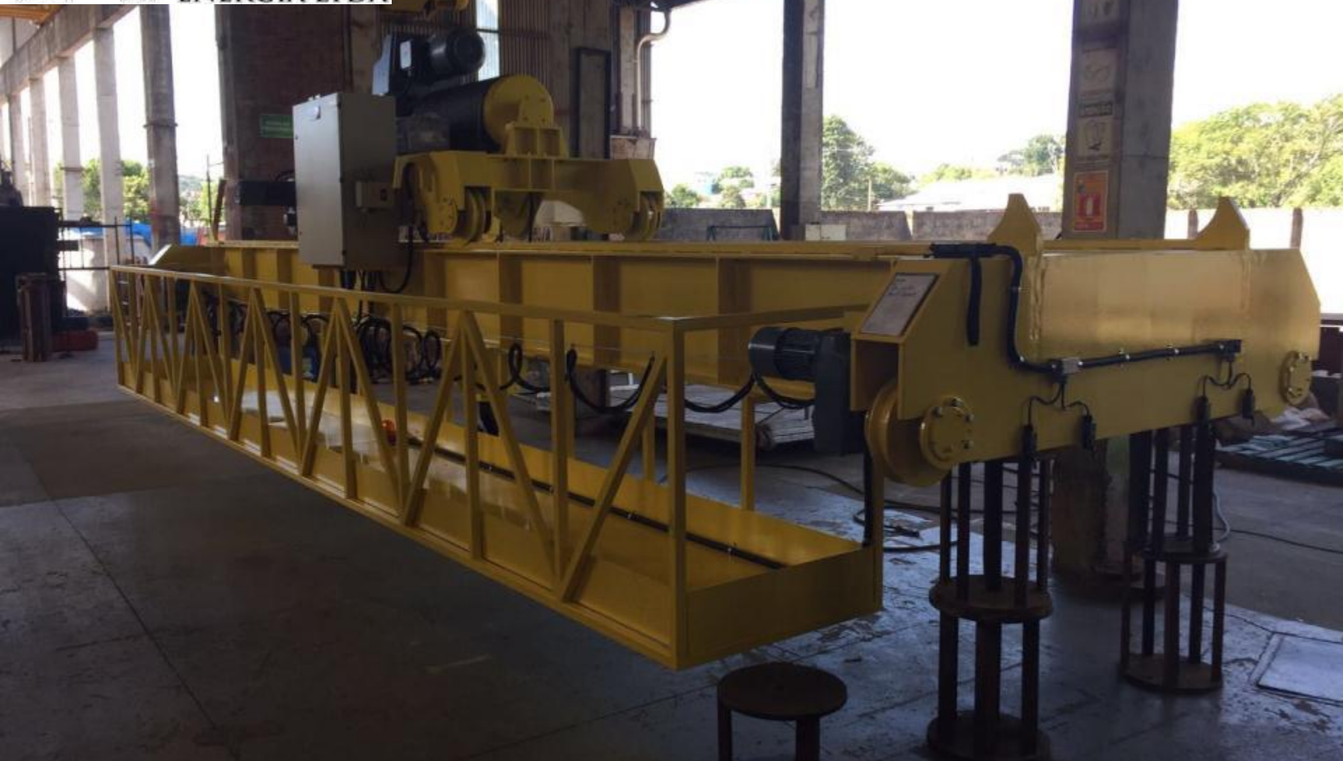
PONTE ROLANTE PRONTA NA FÁBRICA