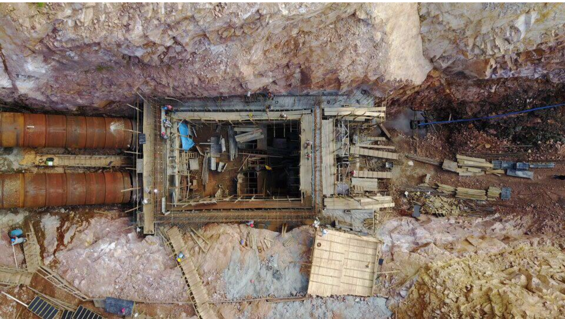
VISTA SUPERIOR DA CASA DE FORÇA