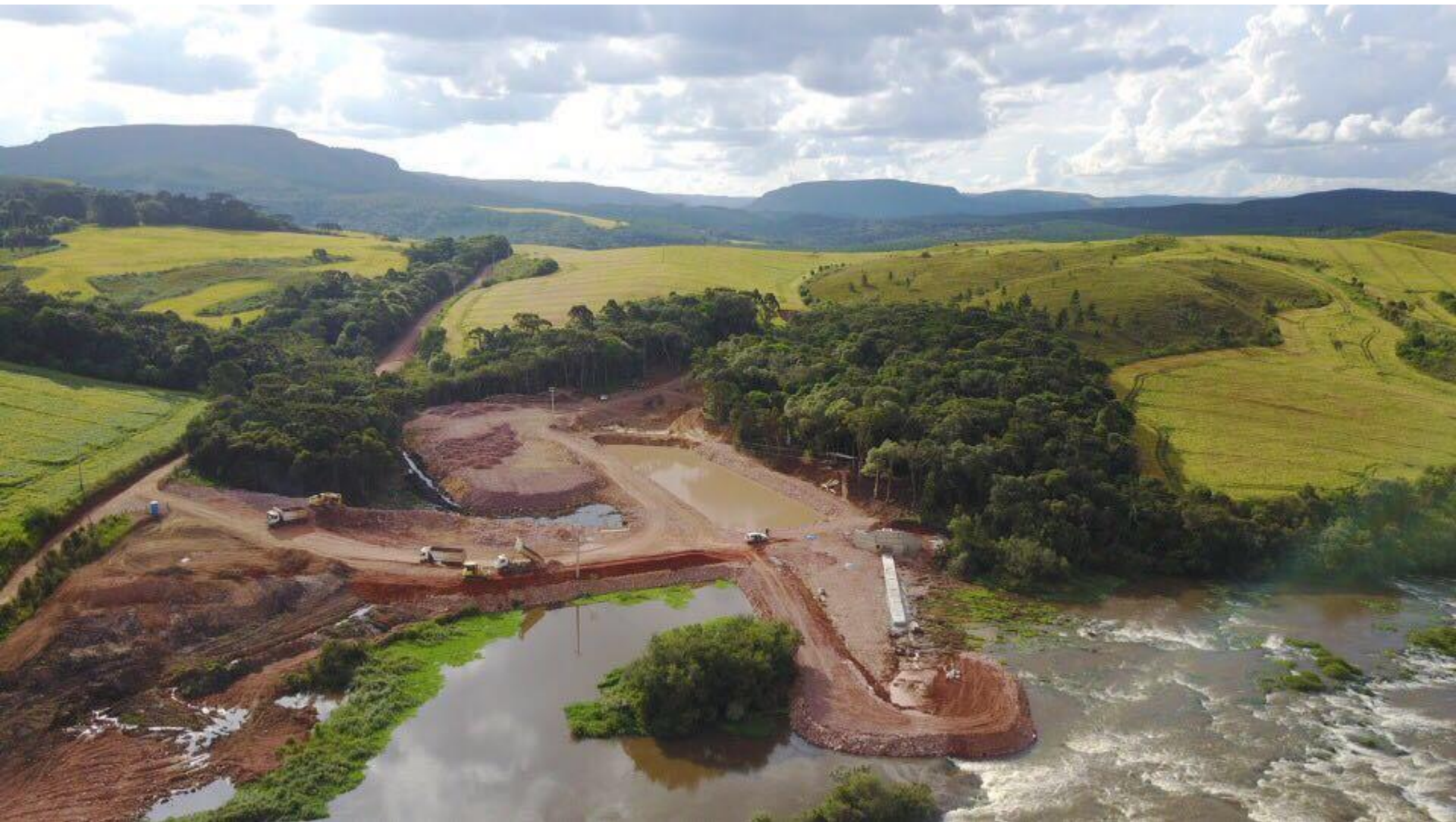
EXECUÇÃO DO DIQUE DA TOMADA D'ÁGUA DO CANAL