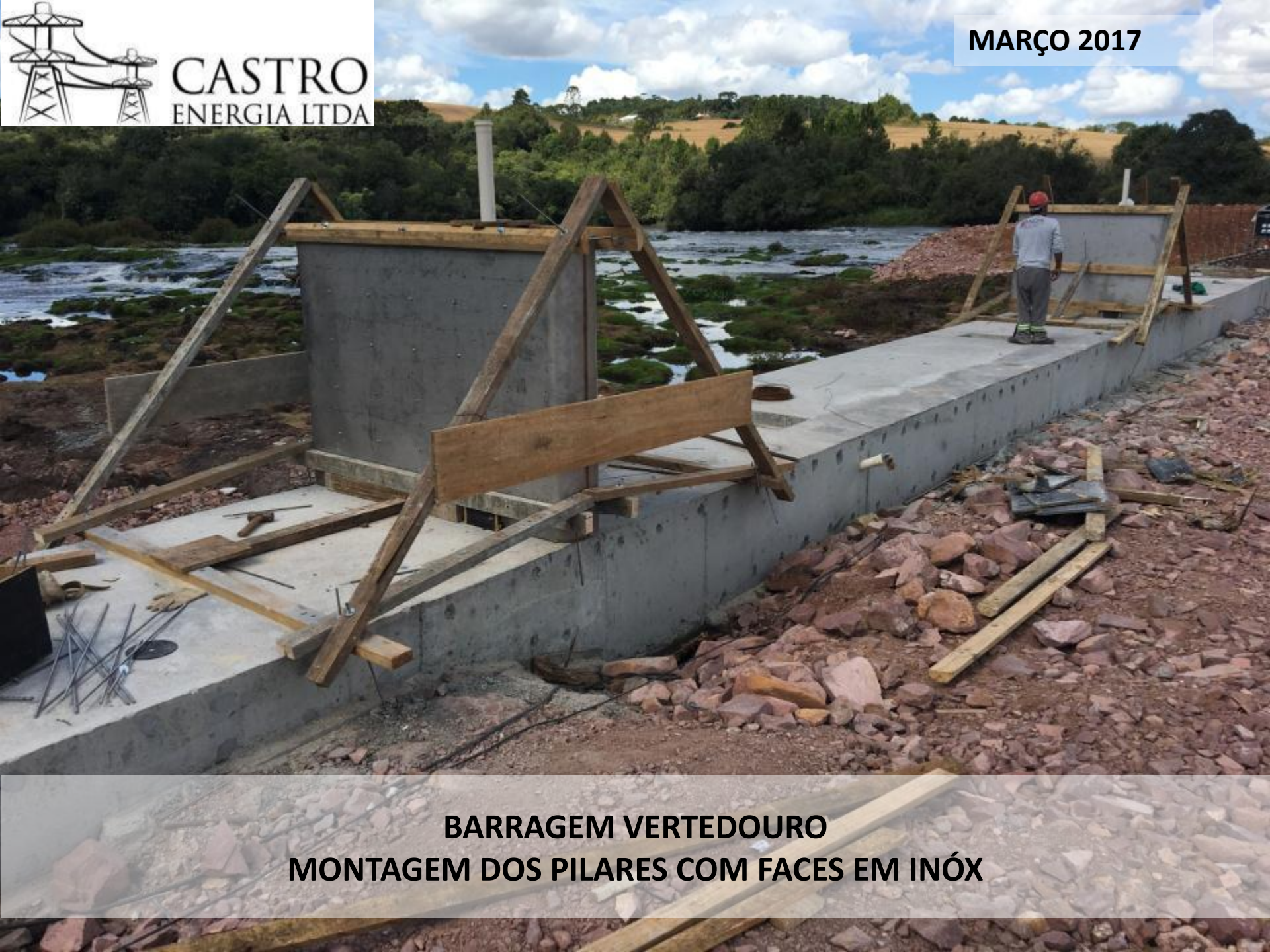
BARRAGEM VERTEDOURO MONTAGEM DOS PILARES COM FACES EM INÓX