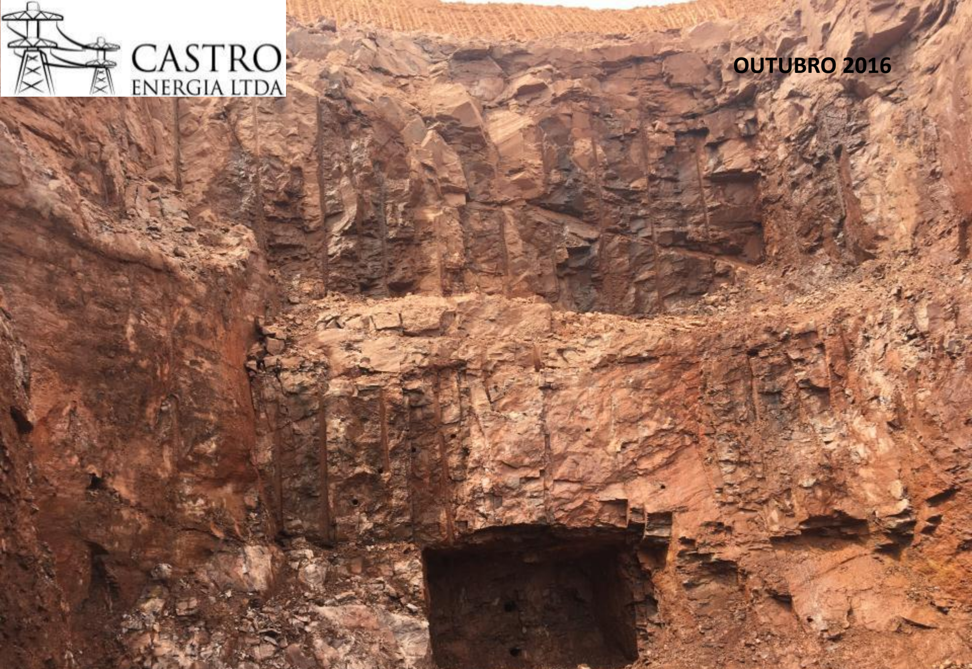
TÚNEL ADUTOR PILÃO DE INÍCIO DO TÚNEL