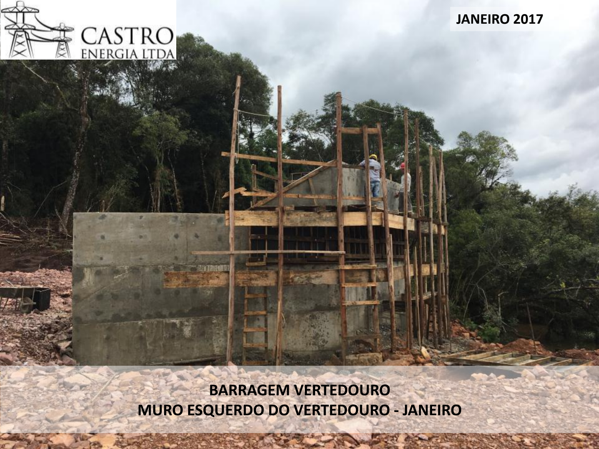
BARRAGEM VERTEDOURO MURO ESQUERDO DO VERTEDOURO - JANEIRO