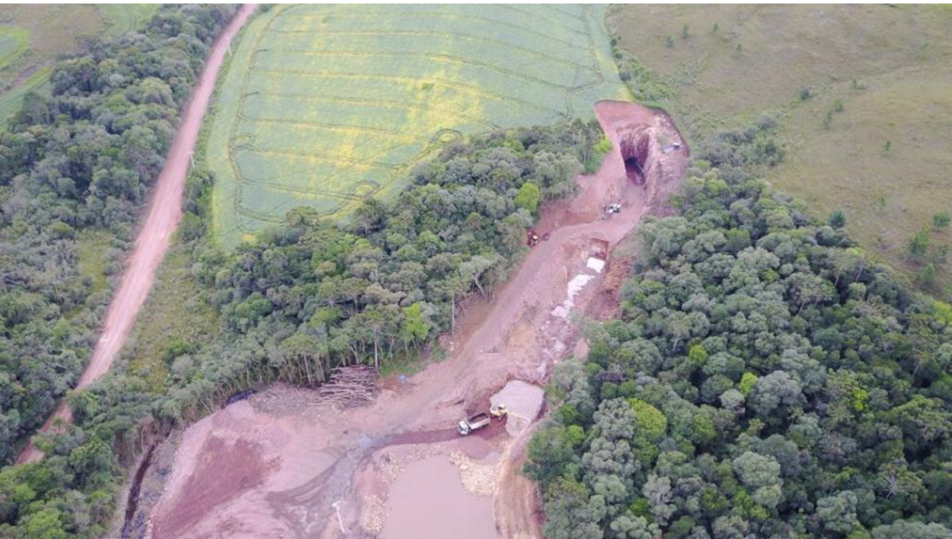
TÚNEL ADUTOR VISTA AÉREA DO EMBOQUE