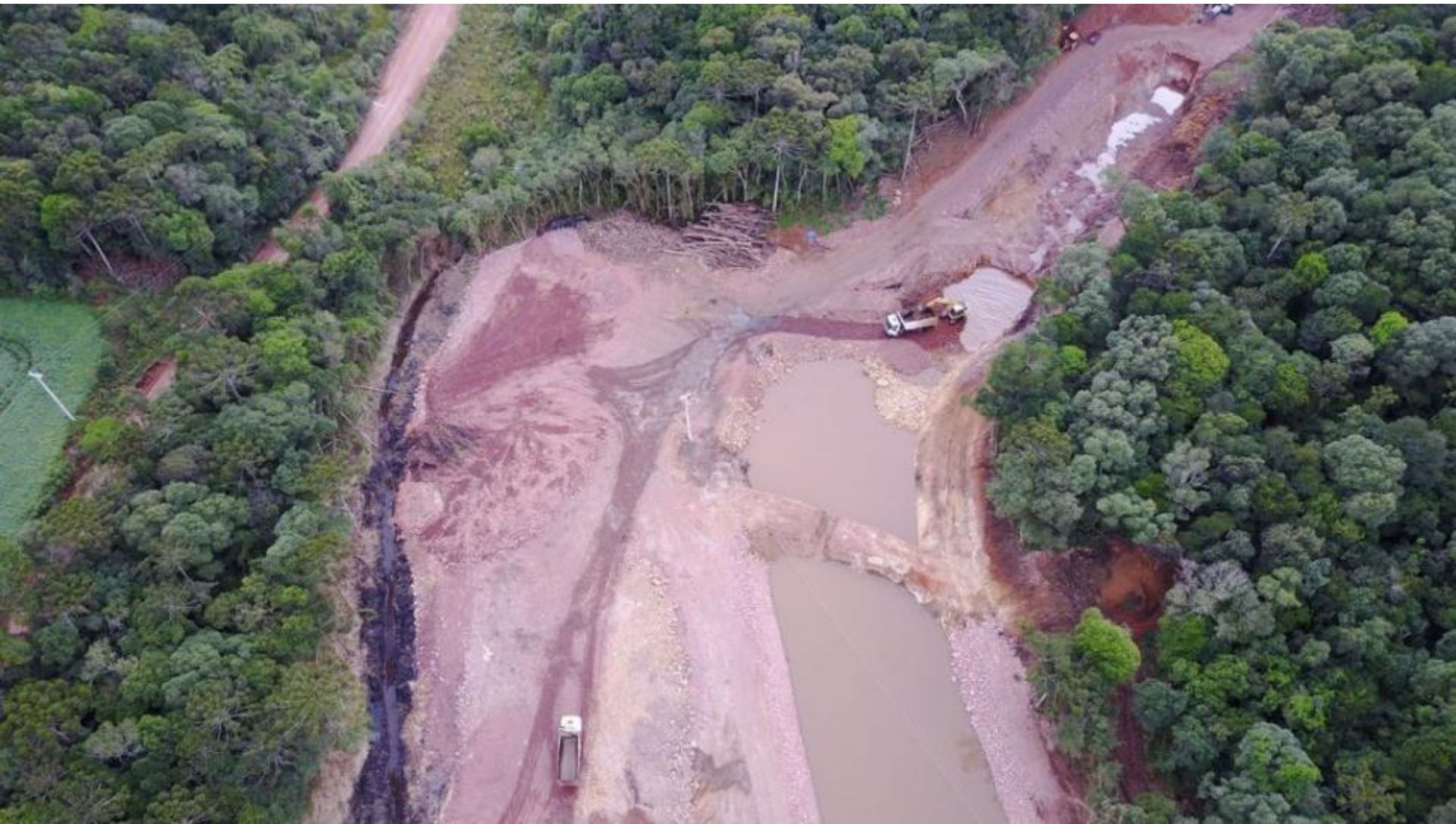
CANAL DE APROXIMAÇÃO VISTA AÉREA