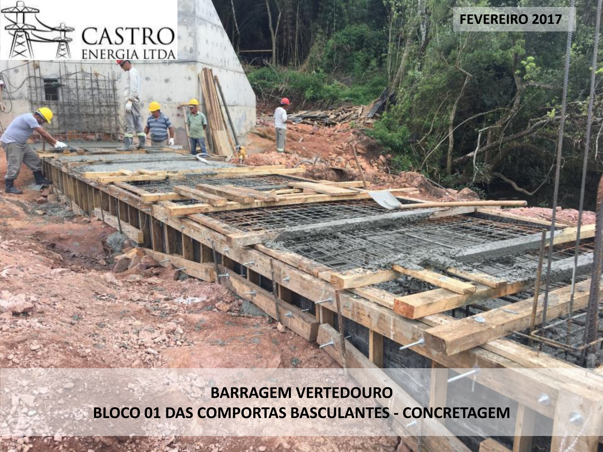
BARRAGEM VERTEDOURO BLOCO 01 DAS COMPORTAS BASCULANTES - CONCRETAGEM