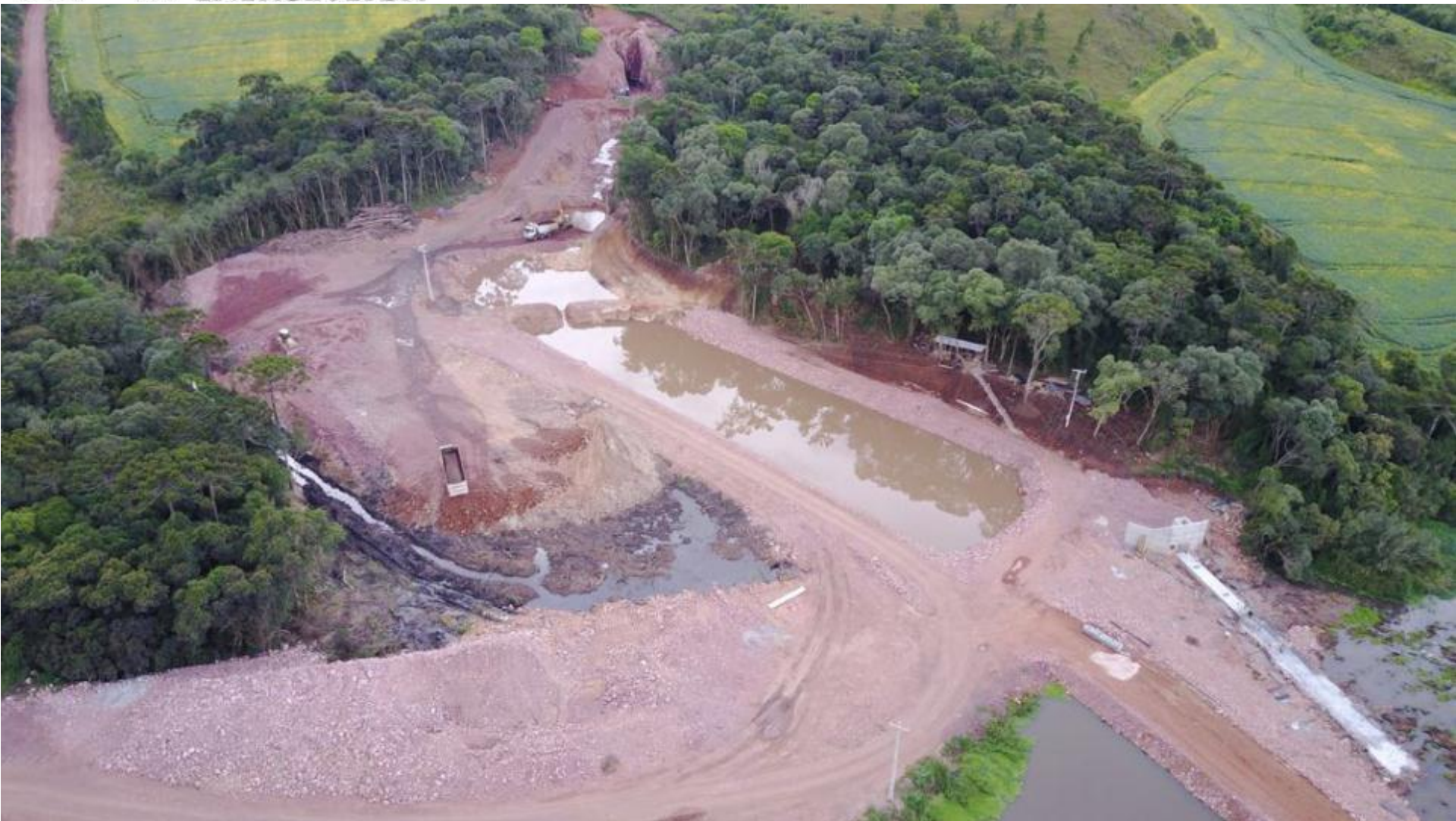
VISTA GERAL DO SETOR DE MONTANTE BARRAGEM VERTEDOURO – CANAL DE APROXIMAÇÃO E EMBOQUE DO TÚNEL