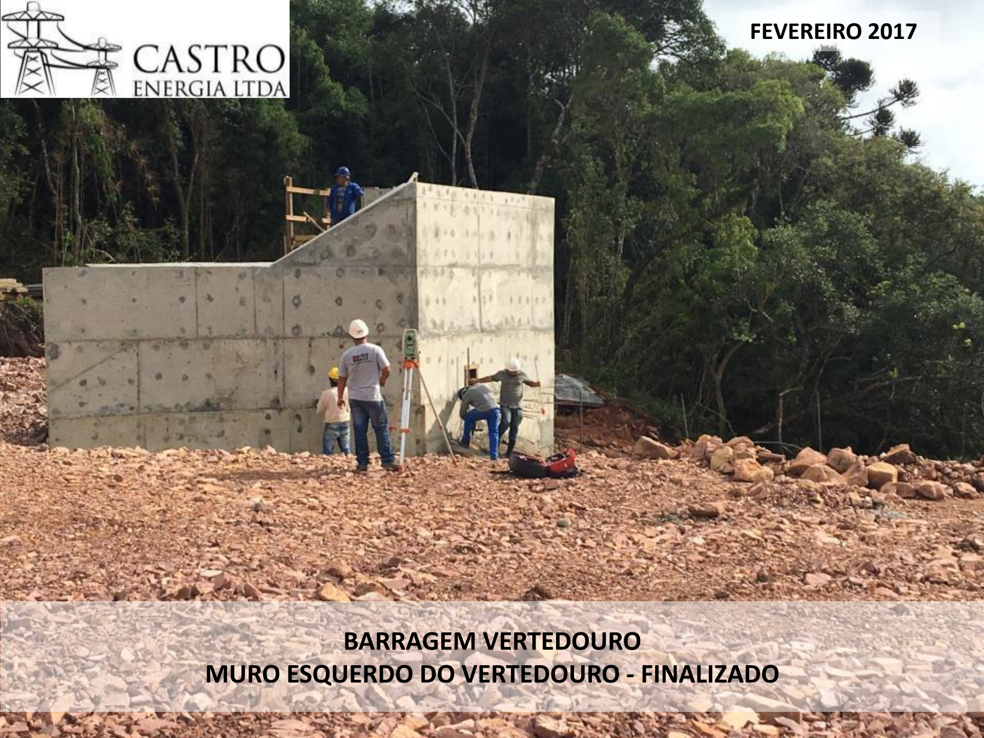
BARRAGEM VERTEDOURO MURO ESQUERDO DO VERTEDOURO - FINALIZADO