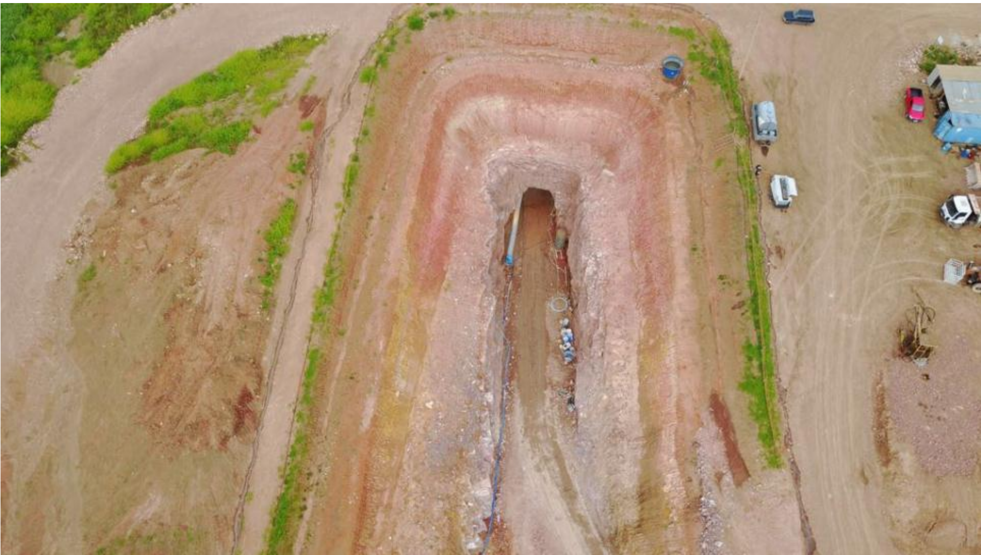
TÚNEL ADUTOR VISTA AÉREA DO DESEMBOQUE