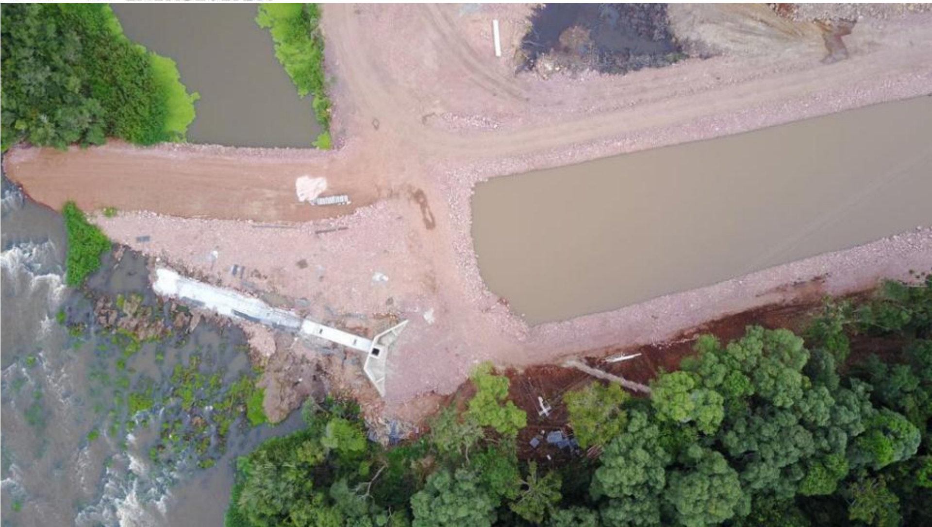
BARRAGEM VERTEDOIRO E CANAL DE APROXIMAÇÃO VISTA AÉREA