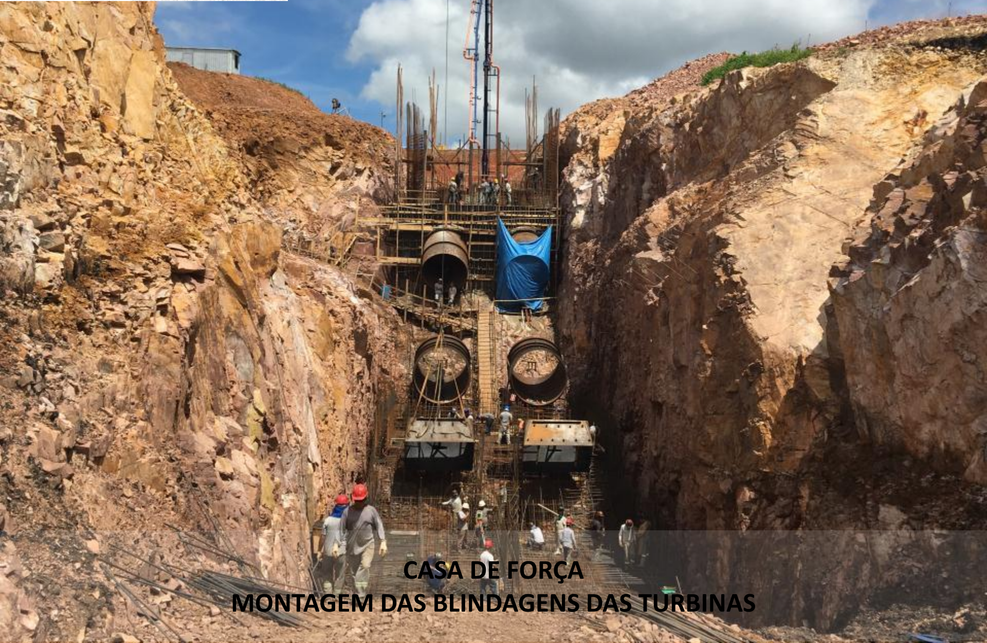
CASA DE FORÇA MONTAGEM DAS BLINDAGENS DAS TURBINAS