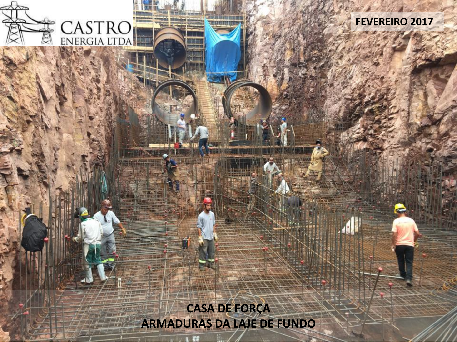
CASA DE FORÇA ARMADURAS DA LAJE DE FUNDO