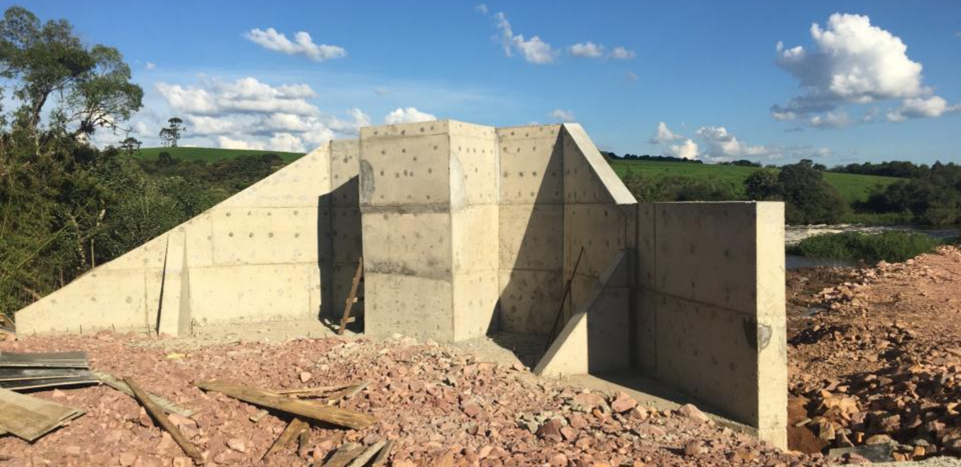
BARRAGEM VERTEDOIRO MURO ESQUERDO DO VERTEDOIRO - FINALIZADO