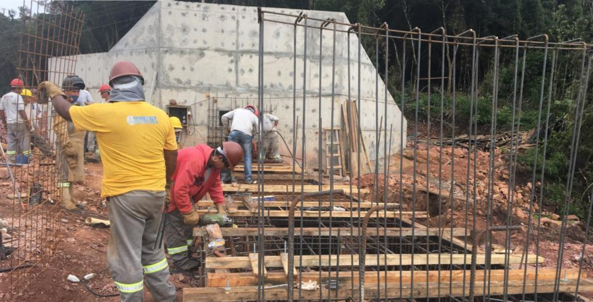
BARRAGEM VERTEDOURO BLOCO 01 DAS COMPORTAS BASCULANTES