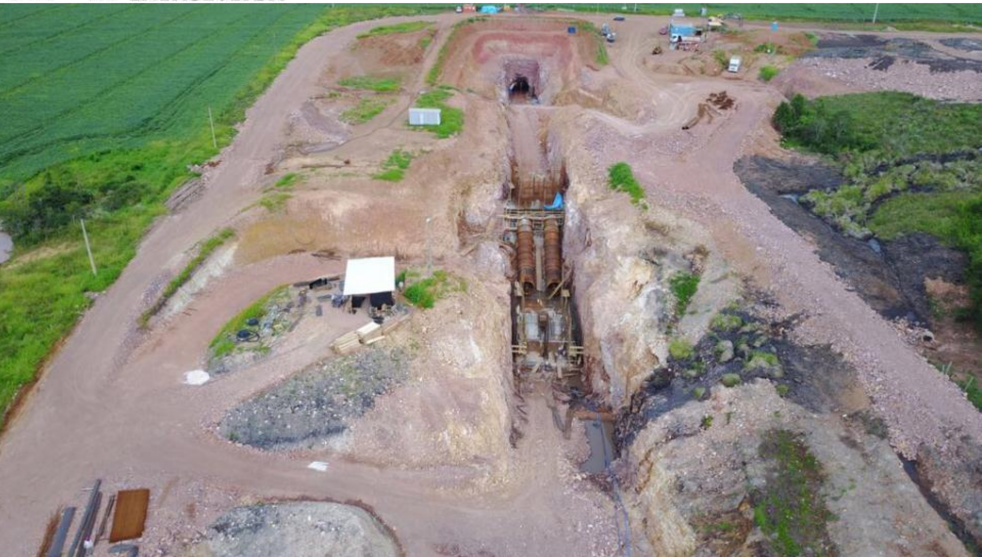
VISTA GERAL DO SETOR DE JUSANTE – TÚNEL – CANAL – TOMADA D'ÁGUA – CONDUTO E CASA DE FORÇA