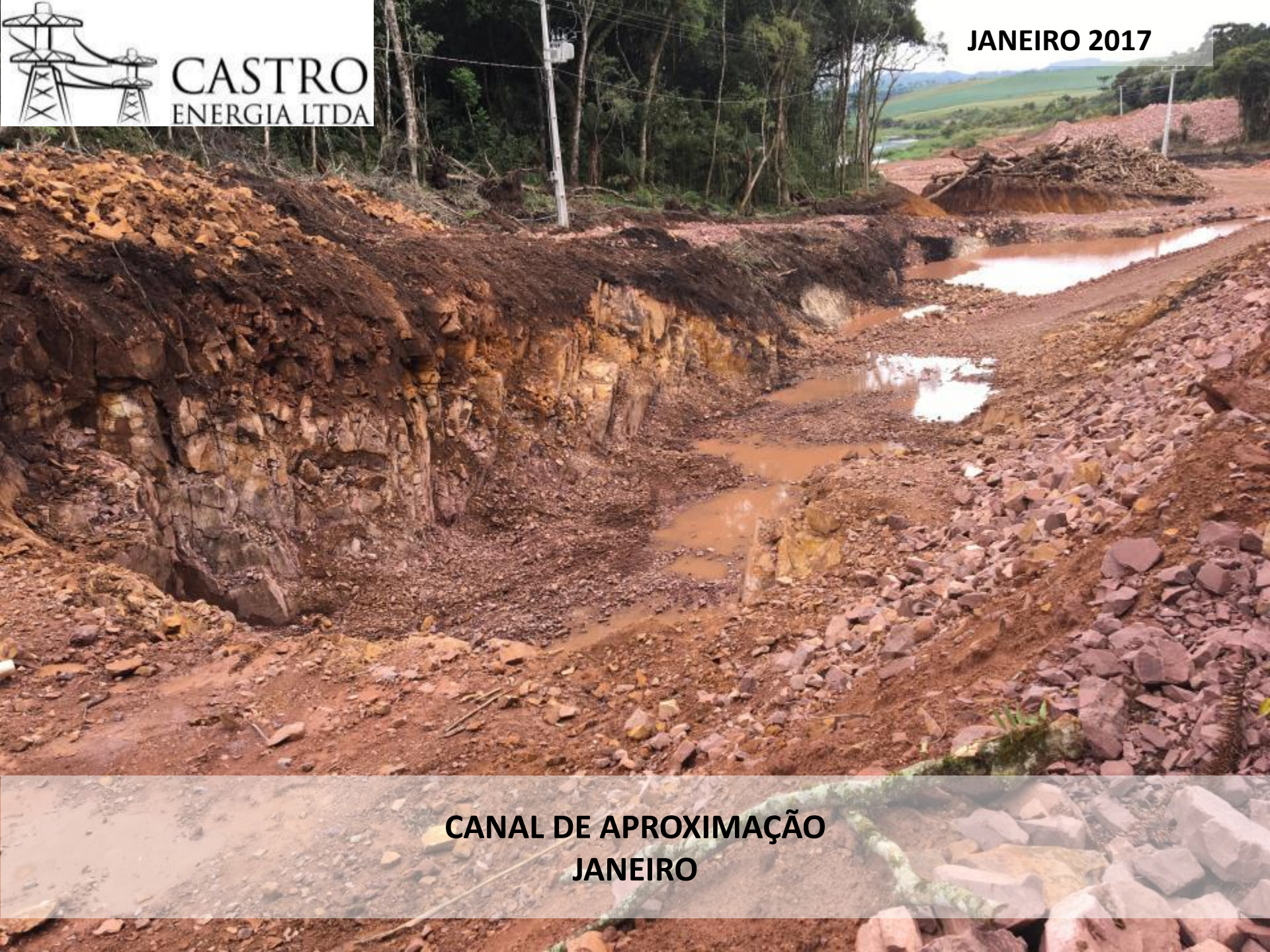
CANAL DE APROXIMAÇÃO JANEIRO