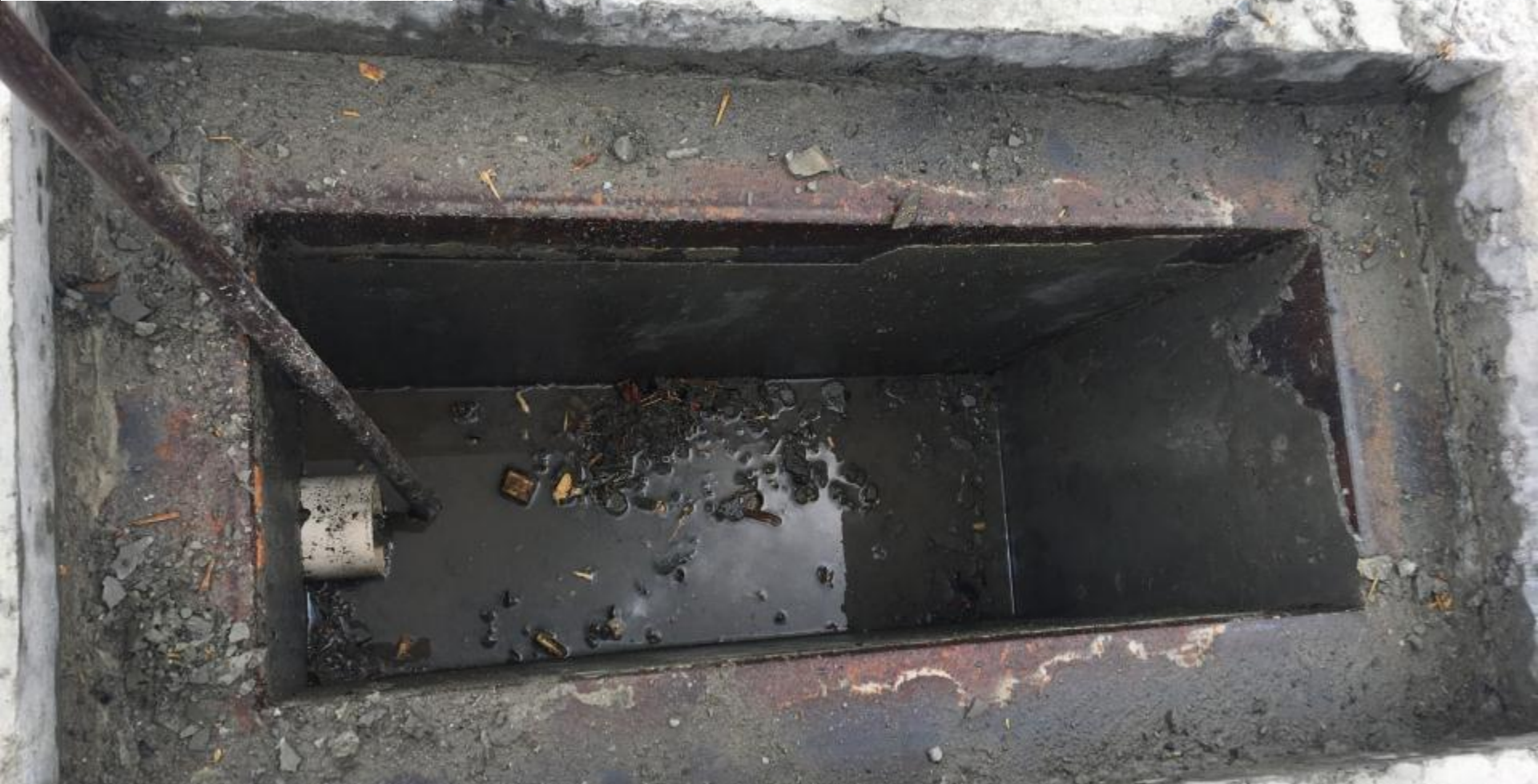
BARRAGEM VERTEDOURO NICHOS DOS PISTÕES