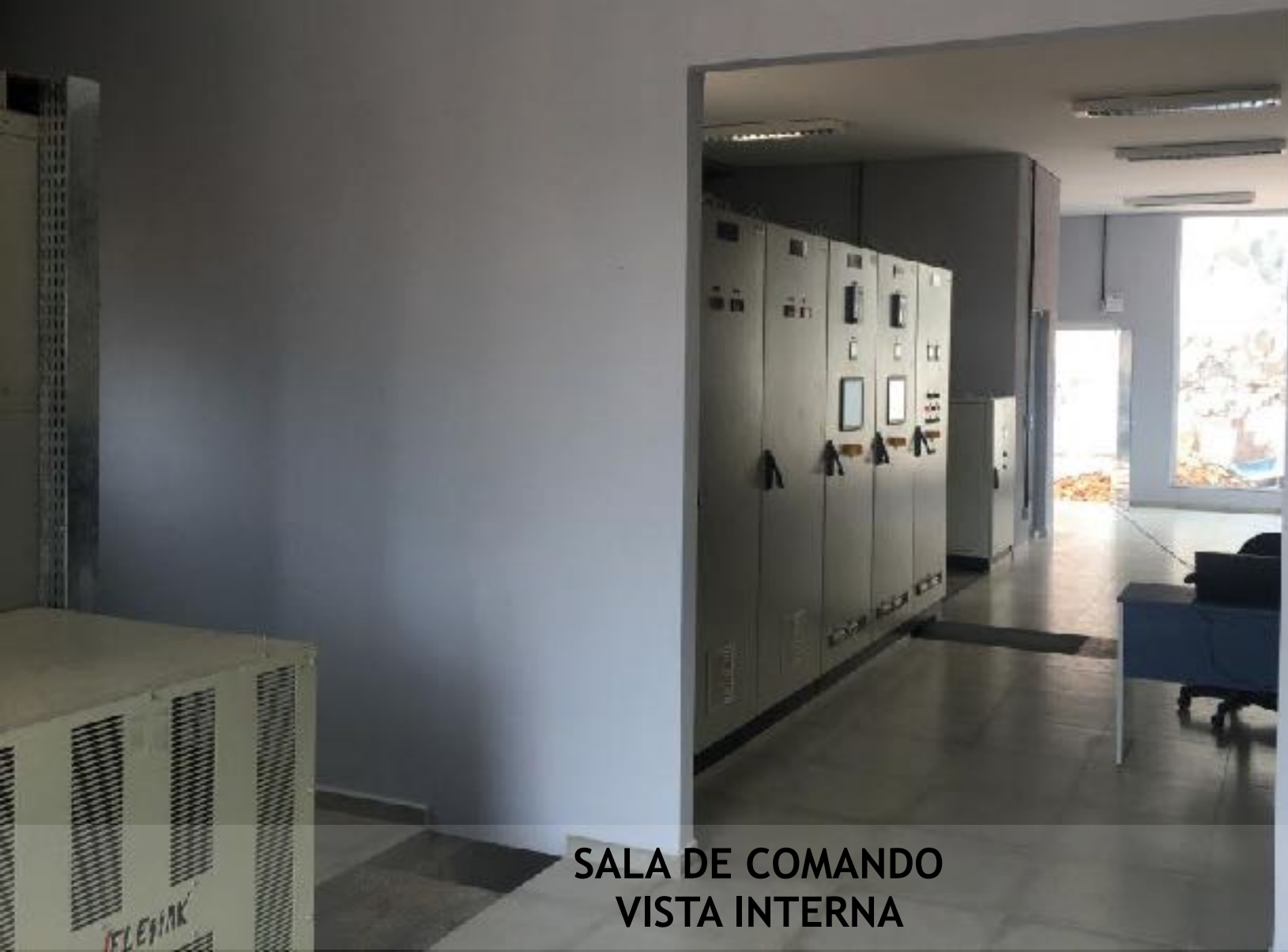
SALA DE COMANDO VISTA INTERNA