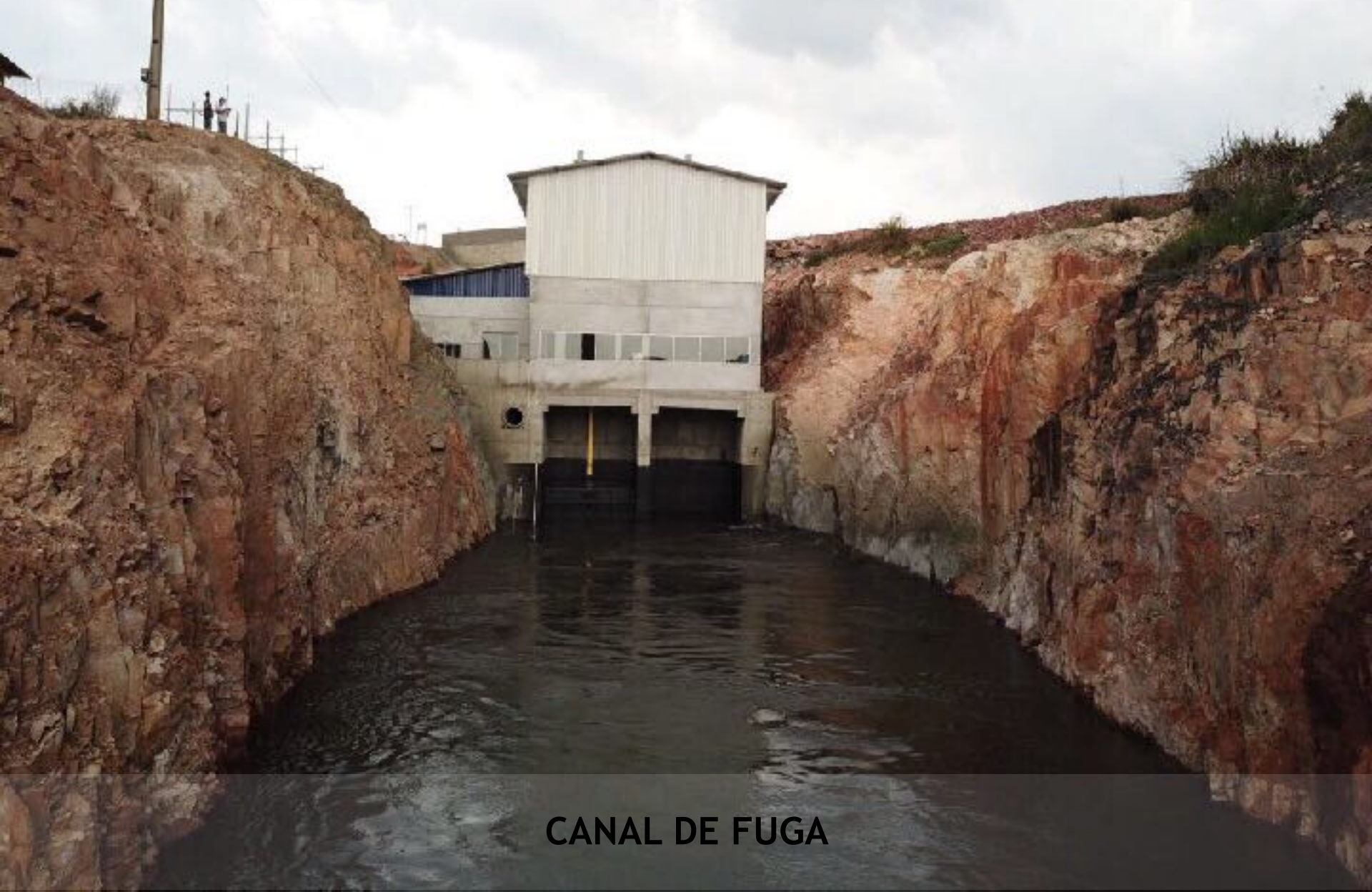
CANAL DE FUGA