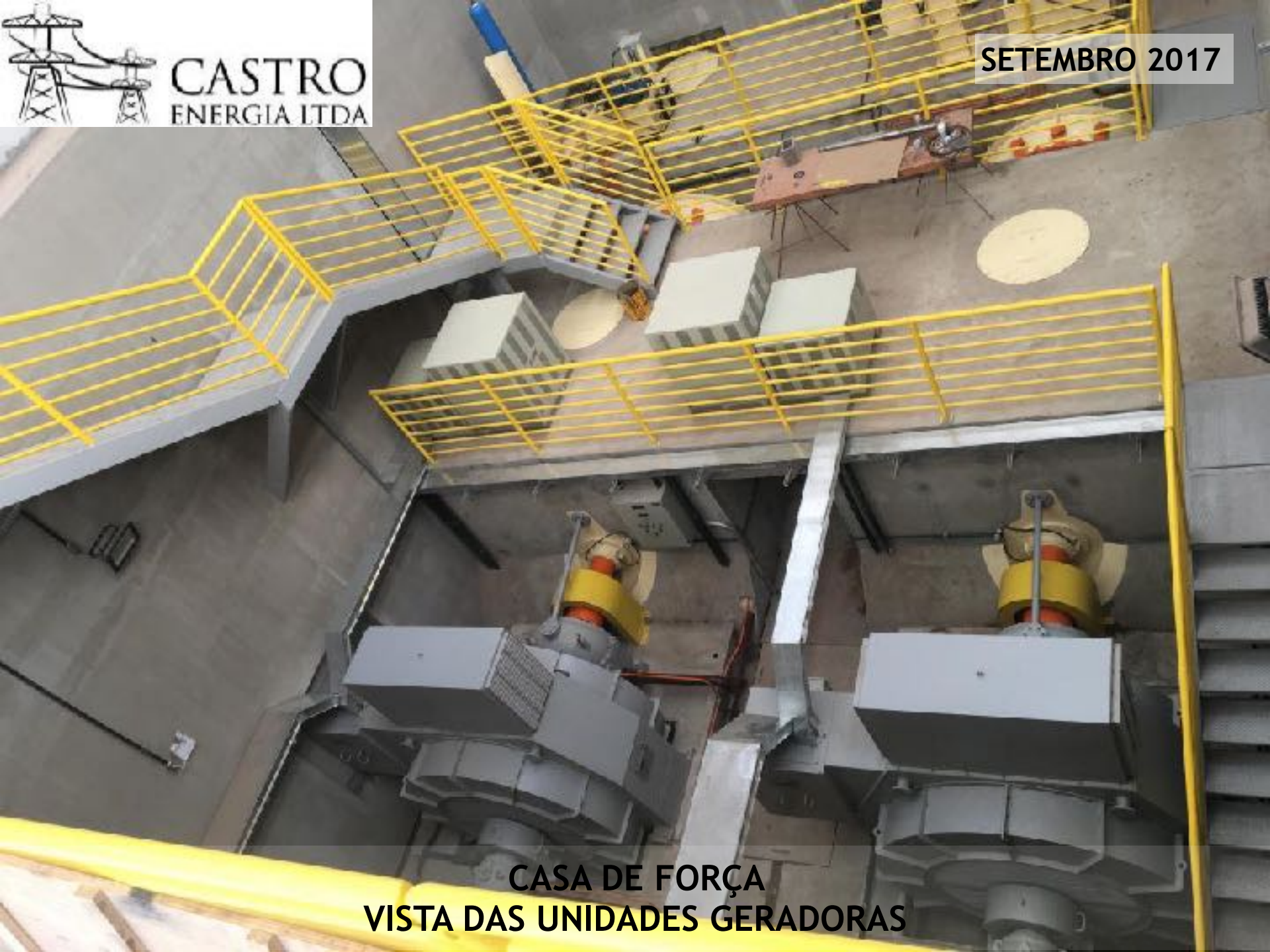
CASA DE FORÇA VISTA DAS UNIDADES GERADORAS