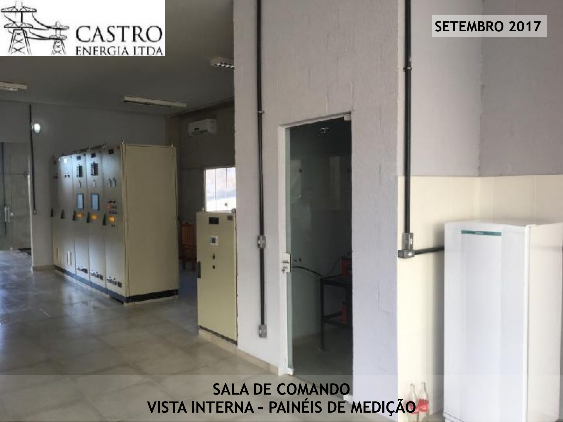
SALA DE COMANDO VISTA INTERNA - PAINÉIS DE MEDIÇÃO