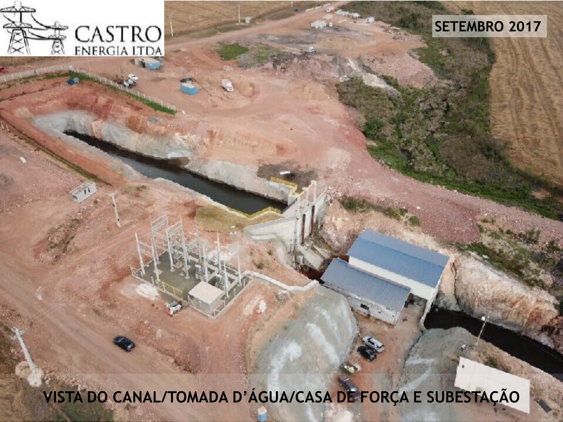
VISTA DO CANAL/TOMADA D'ÁGUA/CASA DE FORÇA E SUBESTAÇÃO