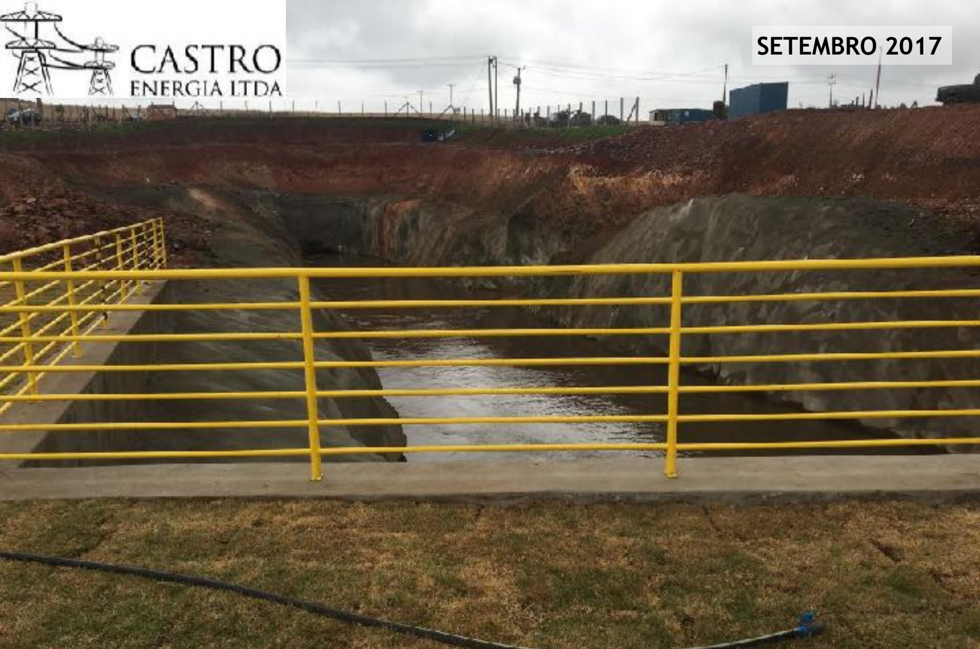
CANAL ADUTOR TRECHO ENTRE O DESEMBOQUE E A TOMADA D'ÁGUA