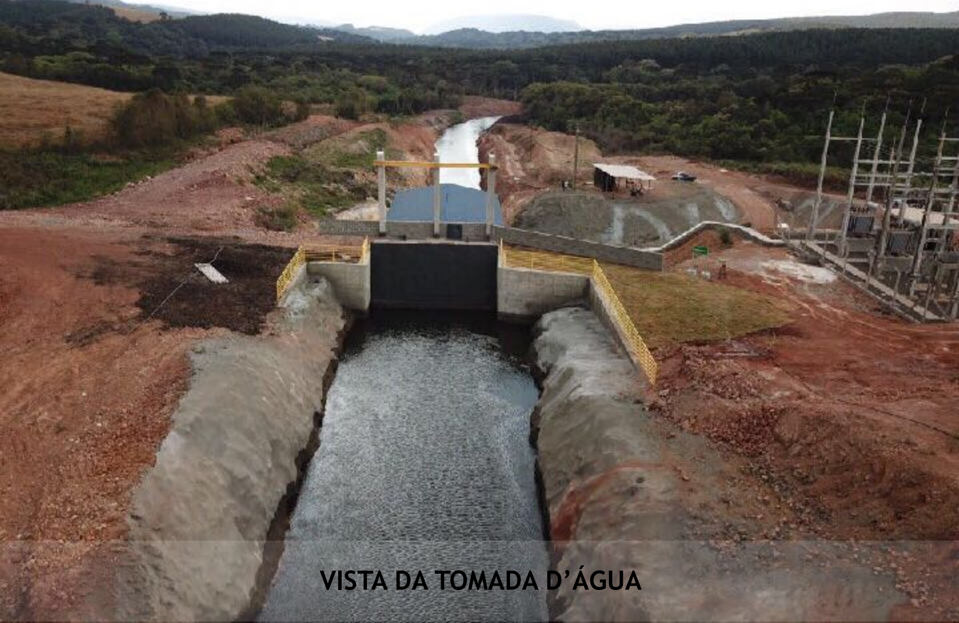
VISTA DA TOMADA D'ÁGUA