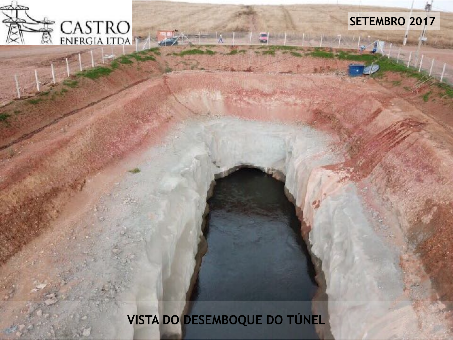
VISTA DO DESEMBOQUE DO TÚNEL